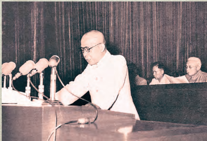
▲1955年7月,李富春在一届全国人大二次会议上作《关于发展国民经济的第一个五年计划的报告》。