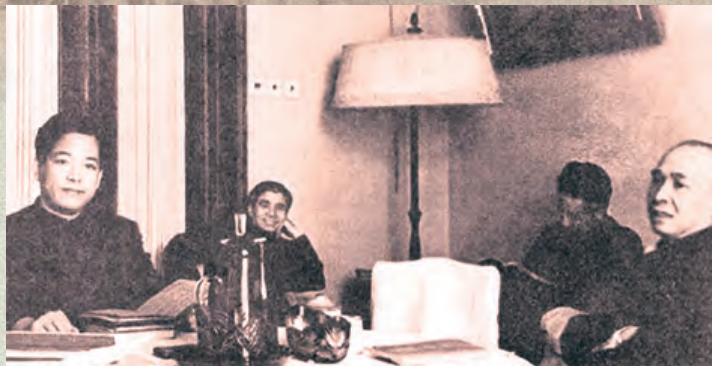
▲1953年3月,李富春在莫斯科主持讨论与苏方谈判的准备工作。右起:李富春、王士光、陈平、袁宝华。