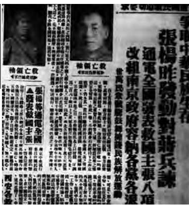
▲当年刊登在《西北文化日报》上的西安事变的消息

蒋介石进了大楼,走进刚刚为他整理好的房间,他将被子翻过来,里朝外盖在身上。卫兵端去木炭火盆供他取暖,他说不要,端出去。王志屏向王副官汇报。王副官说不要就端出来,同时命令把门关上。蒋介石看到闭门,就大声喊:“把门开开,把门开开。”王志屏把开门的事再次向王副官报告。一会儿,宪兵营营长宋文梅进去对