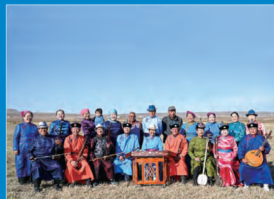
■乐队成员在道尔吉的草场上合影