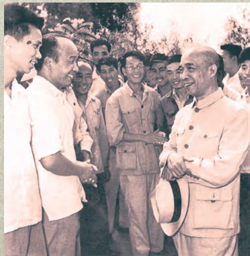
▲1958年夏,李富春在天津东郊新光村与下放的机关干部交谈。