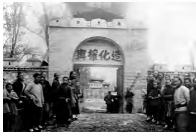
丁宝桢创设的山东机器局（拍摄于1908年）

人夹杂其中”，自行设计厂房，安装机器和组织生产，成为“师夷长技以制夷”的典范。投产以后以制造火药为主，兼造马梯尼洋枪，济南真正使用机器生产的近代工业即始于此。