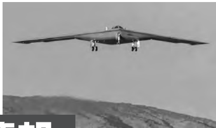
▲ B-21 轰炸机

回顾“二战”历史,B-17、B-24、B-29、兰开斯特等战略轰炸机叱咤风云,从空中将柏林、德累斯顿、东京等大城市几乎夷为平地,更在广岛、长崎投下划时代的原子弹。然而战后随着导弹受宠,战略轰炸机过时的论调就从未停歇。