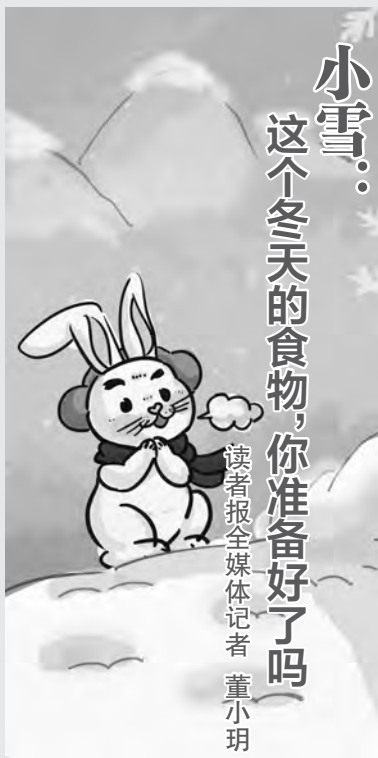
▲读者报全媒体记者 王欣/绘

当然,要想让蔬菜储存时间更久一点,还可以制作腌菜。小雪前后,人们将蔬菜洗净,放进大缸中,加入盐、腐豉等佐料,盖上