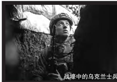
战场中的乌克兰士兵

俄乌冲突刚开始时,没有多少人预料到它会发展为一场持久战。现在,随着战事持续,陷入僵持的战局和愈发严重的伤亡使俄乌两国一些普通人将国家的号召抛在脑后,千方百计避免被征召入伍。