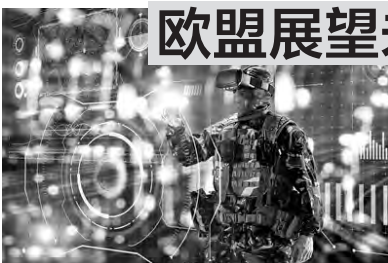
▲ 欧盟构想的未来单兵作战概念图

行动等理念相互影响。三是多层技术相结合的作战态势,如远程精准武器、无人机群、高超音速技术、多重态势感知等,将催生全新作战模式。四是电磁频谱领域的电子战攻防能力,将对战局产生重要影响,保持电磁频谱控制权对于网络战、人工智能运用至关重要。五是未来作战需依托超强的电力等能源保障,军方需运用更具变革性的技术手段,解决能源生产、储存、管理、分配方面的需求。六是未来战争更强调建设强大太空能力,军队