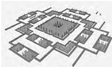
▲甘肃礼县四角坪遗址复原图

礼县一带商周时称“西垂”，是早期秦文化发祥地，也是秦国最早都邑所在地。20世纪90年代礼县大堡子山因发现秦公墓而闻名天下。2019年位于礼县县城东北2.5公里处、与大堡子山遥相呼应的四格子山顶发现一座近9000平方米的大型建筑群遗址——四角坪遗址，再度引发考古学界广泛关注。