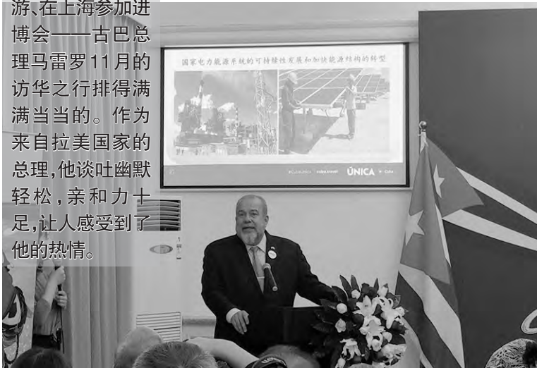
▲古巴总理马雷罗在介绍古巴旅游资源