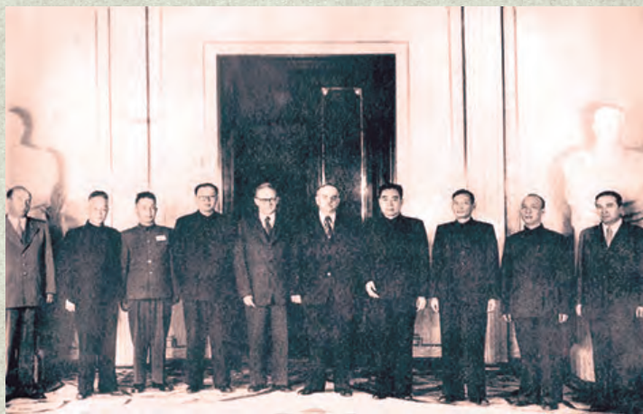
▲时任苏联最高苏维埃主席团主席什维尔尼克和苏联外交部部长维辛斯基同中国政府代表团合影。右二起:李富春、陈云、周恩来、什维尔尼克、维辛斯基、张闻天、粟裕、师哲。