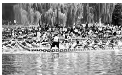
▲在镇远古城举行的龙舟比赛,吸引众多市民游客观赛