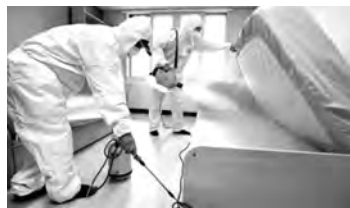
▲韩国防疫人员在大学宿舍灭杀臭虫