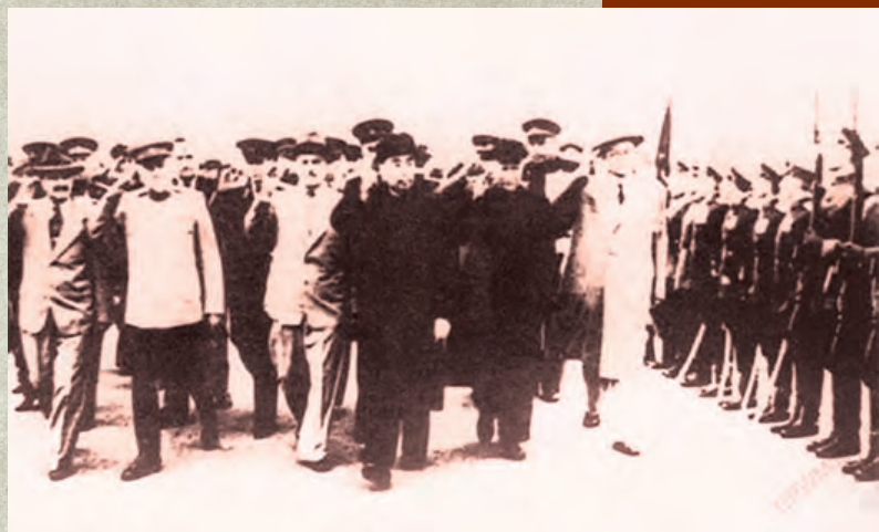
▲1952年8月,李富春随同周恩来率领的中国政府代表团赴苏联,与苏联领导人商谈中国“一五”计划及苏联援助问题。图为代表团抵达莫斯科。